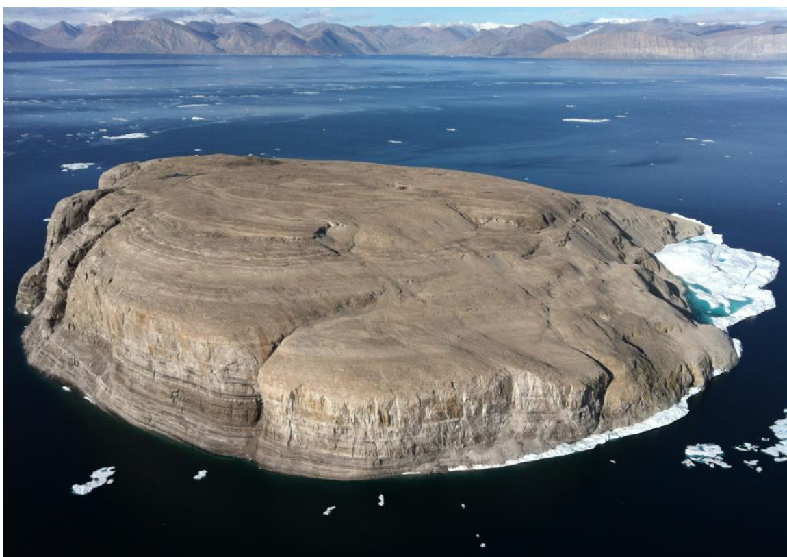
Фото № 1 – Остров Ханс 295

Существует несколько версий происхождения названия острова и истории его открытия. Большинство ученых сходятся во мнении, что остров был назван в честь Ханса Хендрика, гренландского инуита, члена американской полярной экспедиции 1871–1873 годов под руководством Ч. Ф. Холла. Впервые остров Ханс был упомянут в 1876 году в книге американского адмирала Ч. Х. Дависа «Рассказ о северной полярной экспедиции» 294 . В этом же издании была опубликована карта с изображением острова и приведены его географические координаты.