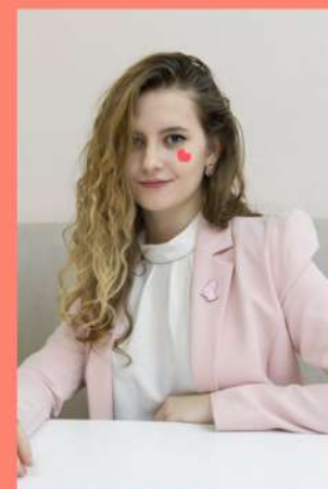
Мария Стрелецкая (Фотограф)