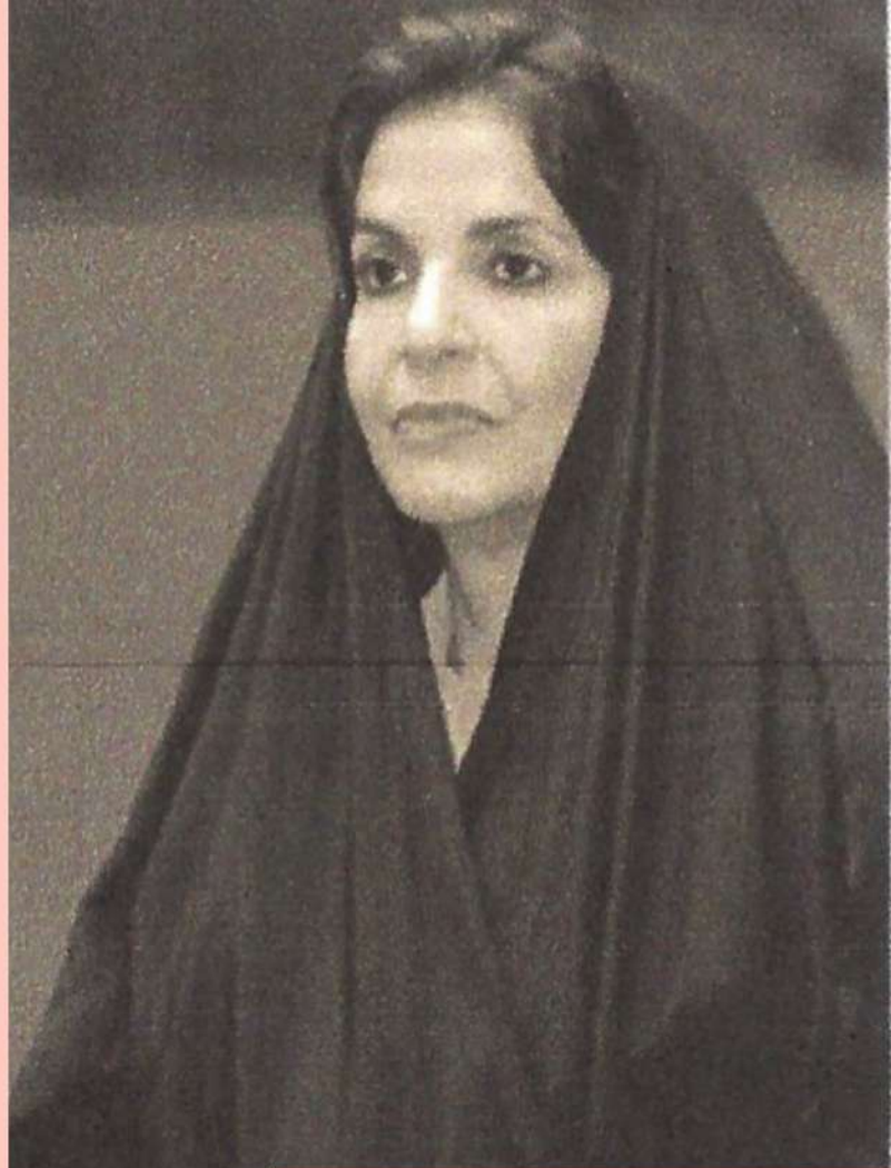
Ее Королевское Высочество Принцесса Сабика бинт Ибрагим Аль Халифа

Несомненно, в настоящее время женщины в дипломатии играют все более значимую роль в укреплении мира и безопасности, в решении важнейших социально-экономических и гуманитарных проблем, и Королевство Бахрейн продолжает поощрять деятельность женщин в дипломатической сфере.