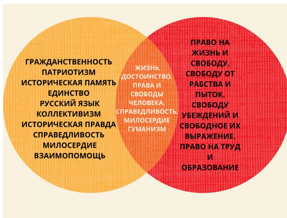
Рис. 2. Диаграмма Венна для отображения пересечения смысловых понятий «традиционные духовно-нравственные ценности» (слева) и «международно-признанные права человека» (справа).

Ниже (рис. 2) представлена диаграмма Венна для отражения совпадающих областей терминов «традиционные духовно-нравственные ценности» и «международно-признанные права человека»: