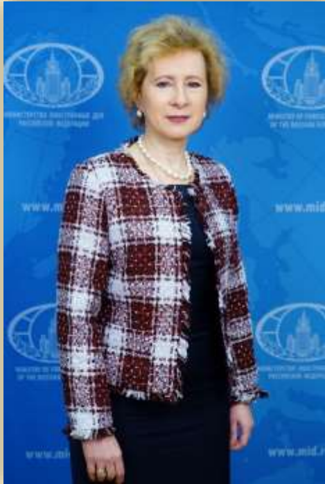
Воробьева Людмила Георгиевна Чрезвычайный и Полномочный Посол Российской Федерации в Республике Индонезии