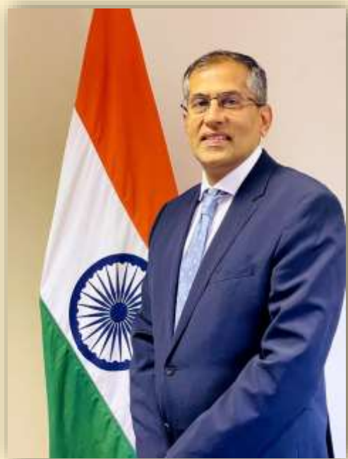
Паван Капур Чрезвычайный и Полномочный Посол Республики Индии в Российской Федерации