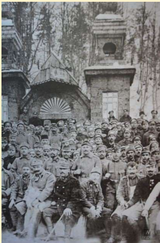
Фото 1916 г.

После окончания войны большинство русских военнопленных было репатрировано, но некоторые из них из-за произошедшей социалистической революции в России предпочли остаться жить в Словении. Оказавшись вдалеке от Родины, они каждый год в конце июля, на день св. Владимира собирались у Русской часовни, чтобы вместе с жителями Краньской Горы поклониться памяти погибших здесь соотечественников. Традиция встреч сохранялась и в период между двумя мировыми войнами (1918-1941).