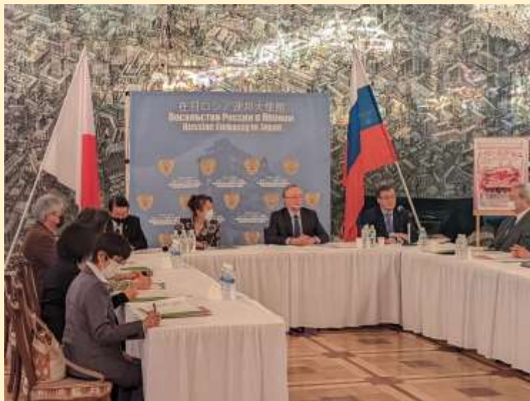
Создание группы поддержки Ансамбля Игоря Моисеева (Посольство России в Японии, 2022 г.)

В течение многих десятилетий богатой истории культурных обменов с Японией выступления наших коллективов и исполнителей организовывались при поддержке Министерства культуры, Федерального агентства по культуре и кинематографии, МИД, Россотрудничества и Посольства в Токио. Большая помощь оказывалась российскими общественными структурами, такими как Международная конфедерация театральных союзов, Общество «Россия-Япония», фонд «Русский мир», Российский фонд культуры.