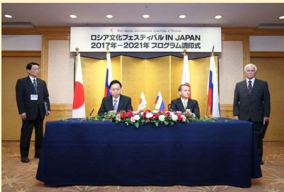
Подписание программы фестиваля на 2017-2021 гг. (С. Нарышкин, Ю. Хатояма)

В обоих государствах были созданы оргкомитеты по проведению Фестиваля. Российский оргкомитет в 2006 г. возглавил С.Е. Нарышкин, занимавший тогда должность заместителя Руководителя Аппарата Правительства Российской Федерации. Через 10 лет руководство российским оргкомитетом было передано специальному представителю Президента Российской Федерации по международному культурному сотрудничеству М.Е. Швыдкому.