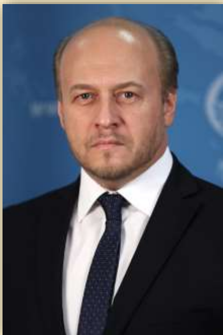
Томихин Евгений Юрьевич Чрезвычайный и Полномочный Посол Российской Федерации в Королевстве Таиланд