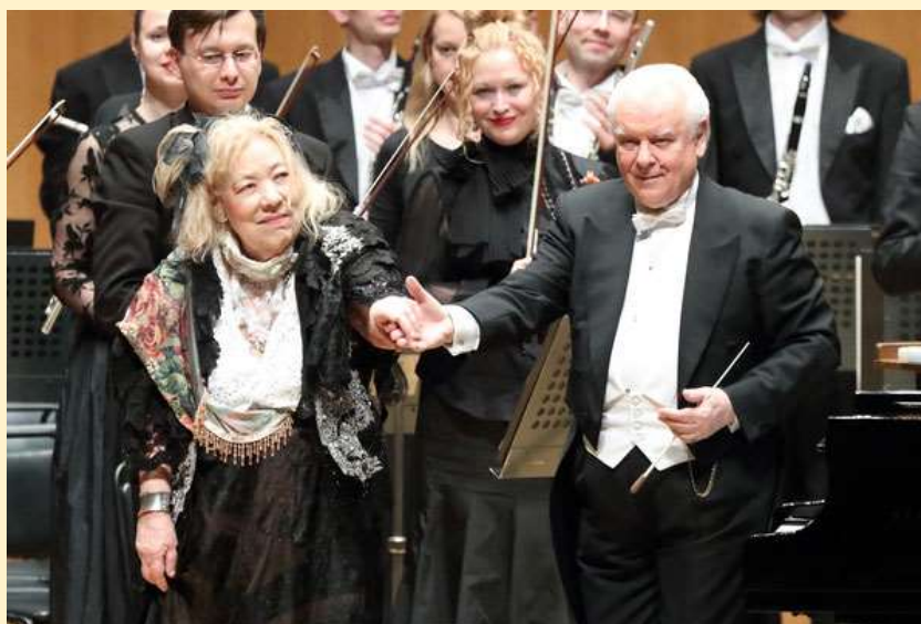
Дирижер Симфонического оркестра Московской филармонии Ю. Симонов

К настоящему времени мероприятия в рамках Фестиваля состоялись во всех 47 префектурах Японии, их посетили более 18 миллионов человек, а перед японской аудиторией выступили более 11 тысяч российских артистов. Это наглядное свидетельство глубочайшего интереса японцев к российскому искусству, стремления японского народа строить дружественные отношения с нашей страной.