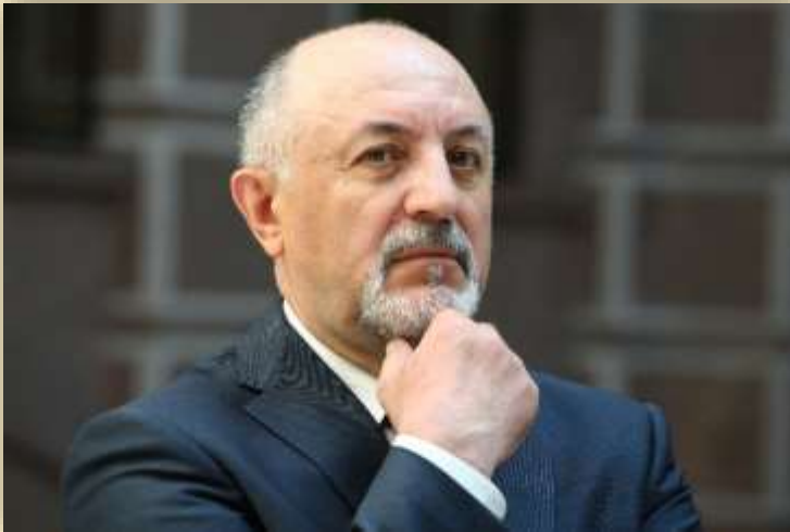
Спринчан Владимир Иванович Чрезвычайный и Полномочный Посол Российской Федерации в Республике Эквадор