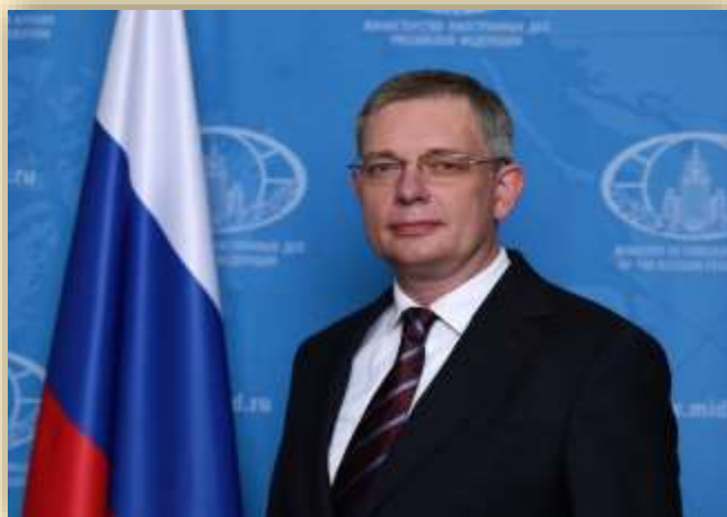
Алипов Денис Евгеньевич Чрезвычайный и Полномочный Посол Российской Федерации в Республике Индии