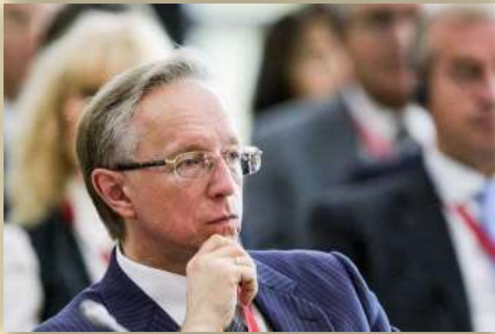
Галузин Михаил Юрьевич Чрезвычайный и Полномочный Посол Российской Федерации в Японии