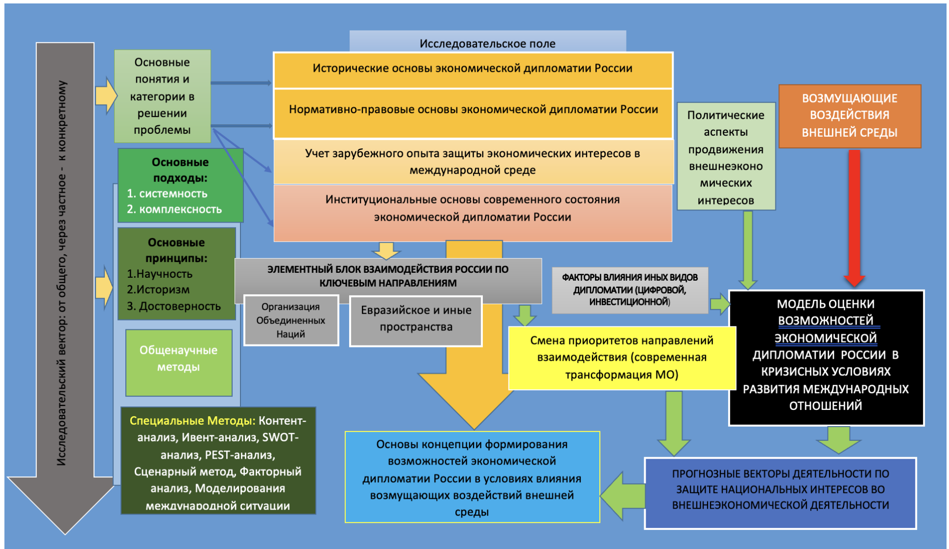
Рисунок Б.1 – Методологические основы исследования современной экономической дипломатии России.